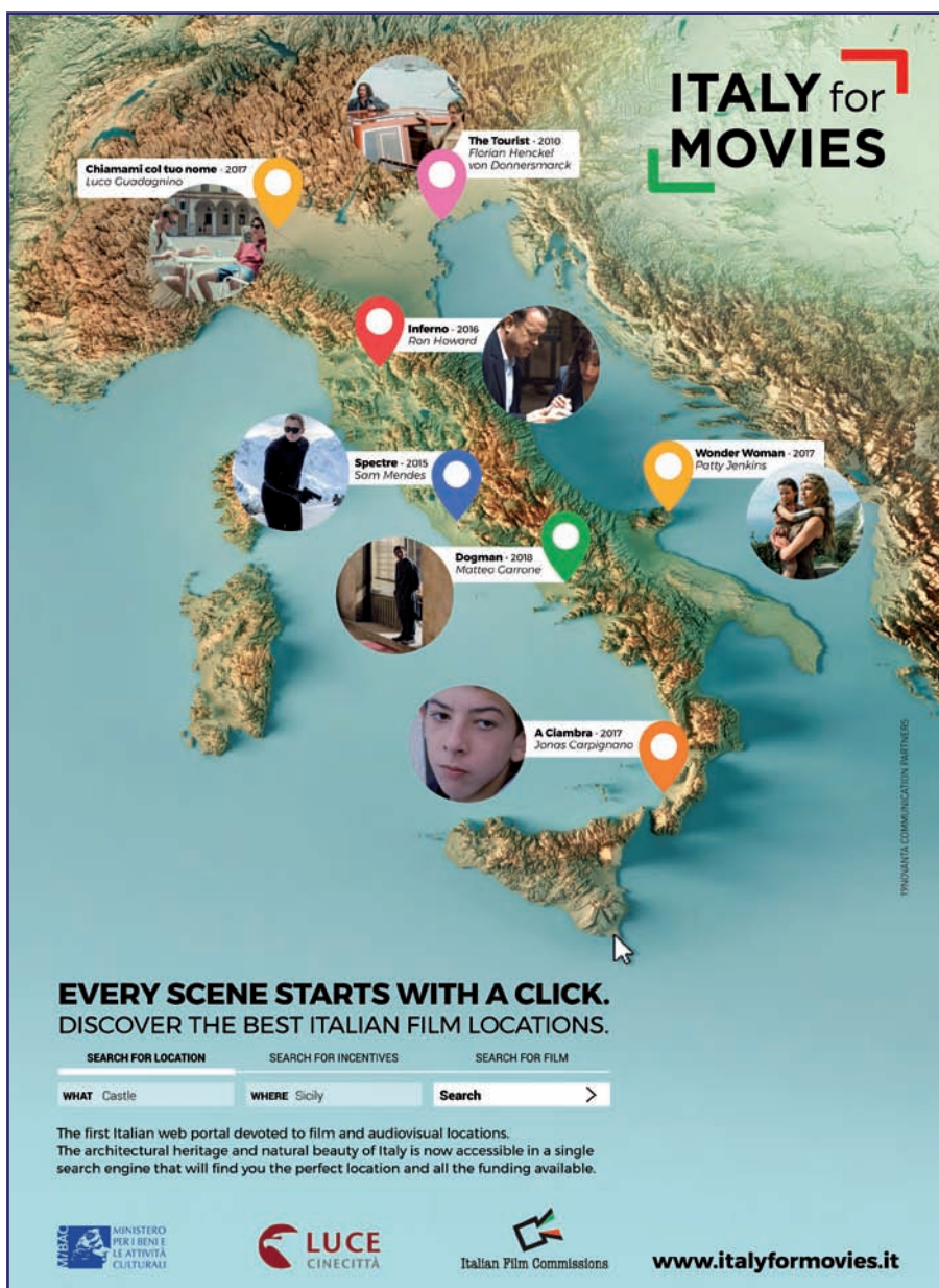
Figura 2. Una pagina promozionale di Italy for Movies

organizzativi e mappe avanzate, in cui sono visibili non solo la location interessata ma anche quelle territorialmente vicine. Contengono inoltre rimandi ai film che vi sono stati girati (e presenti nella mappa dei film) e agli incentivi attivi per quello specifico territorio.