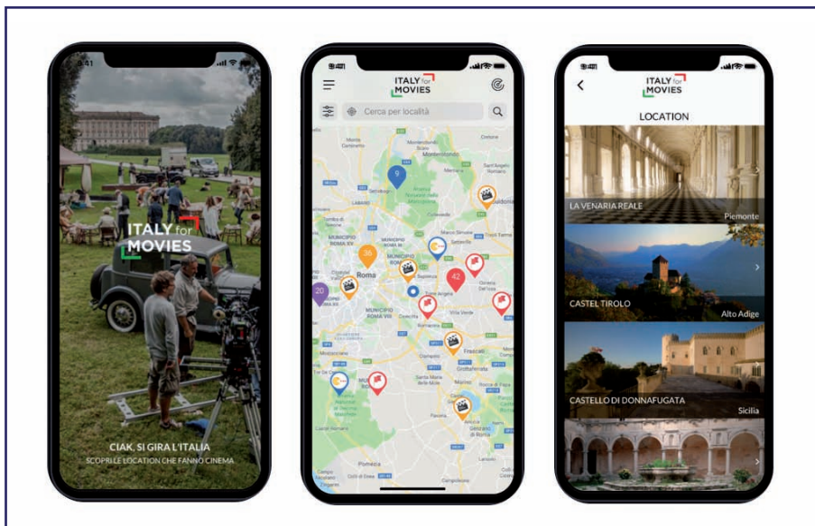
Figura 4. Prototipo dell'App Italy for Movies

Al fine di coinvolgere maggiormente gli utenti sarà data loro la possibilità di interagire con il portale attraverso l'app o direttamente sul sito e tramite i social network. Gli utenti potrebbero ad esempio segnalare la loro location pubblica o i film girati nei luoghi che attraversano.