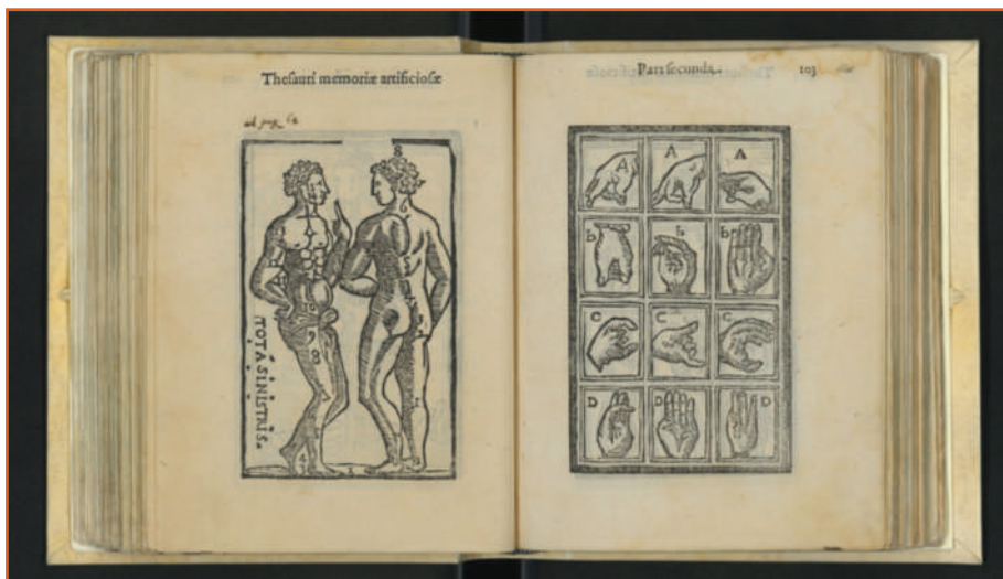
Figura 1. Cosma Rossello, Thesaurus artificiosae memoriae , 1579 (San Marino, Università degli Studi, Biblioteca, AFY 160, c. 102-103)

L'11 dicembre 2006 la Commissione Nazionale Sammarinese per l'UNESCO deliberò l'erogazione di un consistente contributo finanziario richiesto dalla Biblioteca Universitaria per l'intervento di completamento del restauro della sezione antica del Fondo Young. In previsione di questo stanziamento la Biblioteca universitaria organizzò un corso di formazione per i bibliotecari e gli archivisti in collaborazione con l'Istituto della patologia del libro. L'intervento di restauro del fondo di-