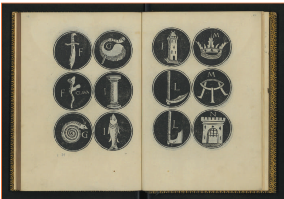
Figura 3. Jacobus Publicius, Oratoriae artis epitoma, 1485 (San Marino, Università degli Studi Biblioteca, AFY 149, c. Hv)

Iniziato il lavoro di acquisizione delle immagini, in accordo con l'Ufficio informatico dell'Ateneo dopo attente valutazioni e sopralluoghi verso biblioteche ormai esperte di progetti digitali sembrò complicato creare una struttura di Digital library con le forze disponibili. Per questo motivo interpellammo l'Istituto centrale per il catalogo unico delle biblioteche italiane e per le informazioni bibliografiche (ICCU), che accolse con interesse la proposta di rendere disponibile la collezione Young sul portale Internet Culturale 4 .